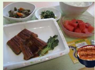
患者さんのリクエストを元に