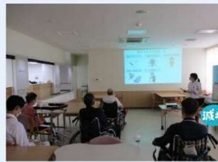
集団栄養指導 ～脳卒中予防講座～