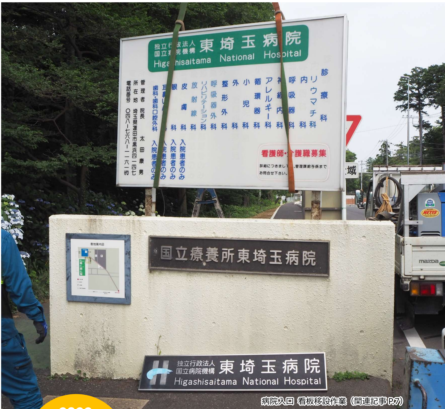
病院入口 看板移設作業 (関連記事P.7)

発行日 令和4年10月 発行人 太田 康男 〒349-0196 埼玉県蓮田市黒浜 4147 電話 048-768-1161 https://higashisaitama.hosp.go.jp/