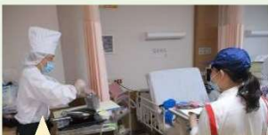
患者さんの目の前でステーキの仕上