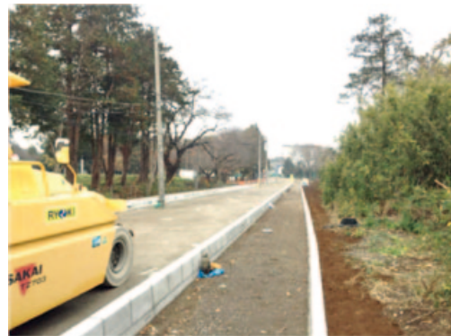
病院裏の市道：左は昨年の4月に撮影。右は今年の12月に撮影。